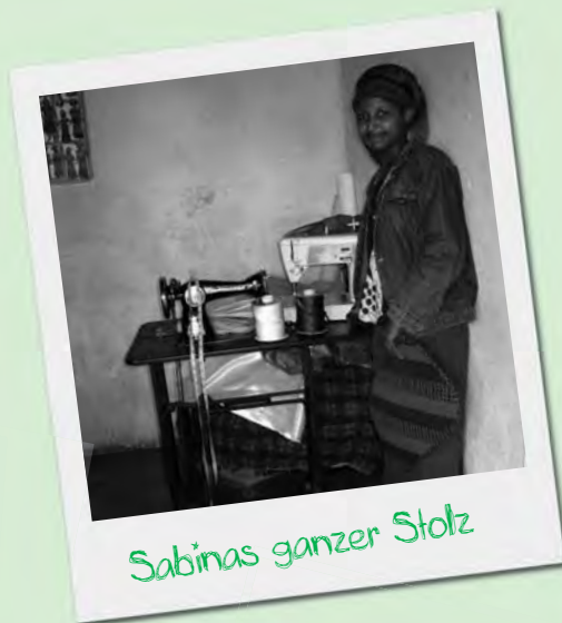
Sabinas ganzer Stolz

DESWOS-Spendenkonto 660 22 21 Sparkasse KölnBonn BLZ 370 501 98 Stichwort WOHNEN IST EIN MENSCHENRECHT