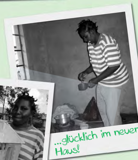
...glücklich im neuen Haus!