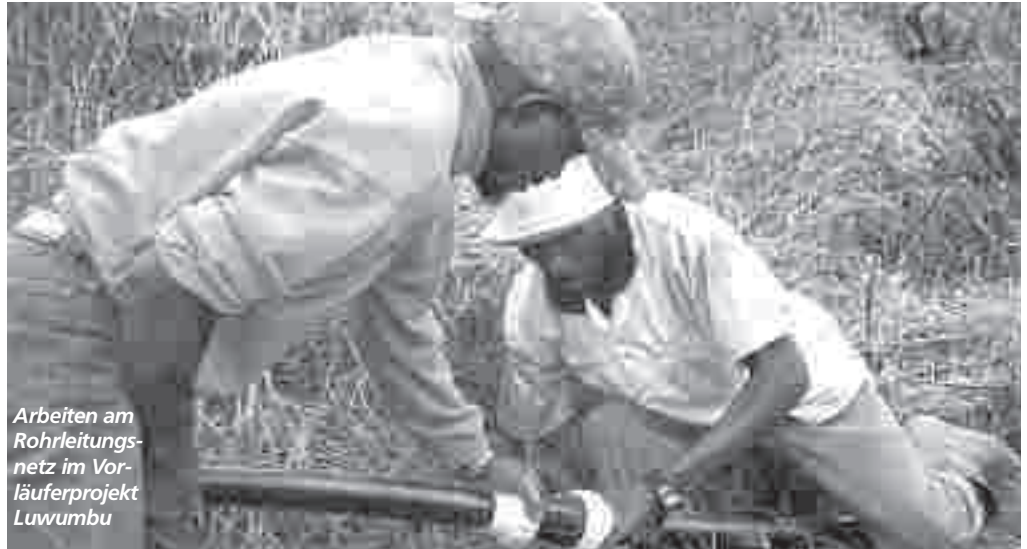
Arbeiten am Rohrleitungsnetz im Vorläuferprojekt Luwumbu

Yohana Sanga gehört zum Workshop Lupila, der gemeinsam mit der DESWOS schon ein ähnliches Wasser-