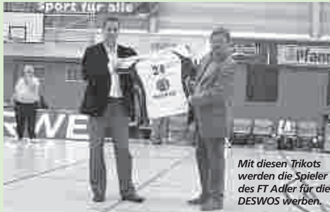
Mit diesen Trikots werden die Spieler des FT Adler für die DESWOS werben.