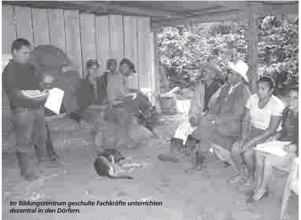
Im Bildungszentrum geschulte Fachkräfte unterrichten dezentral in den Dörfern.

Der Verein steht für Bildung, Selbstbestimmung und für Armutsbekämpfung. In der Schule bekommen die Menschen das Rüstzeug, sich selbst aus der einseitigen Abhängigkeit vom Kaffeeanbau zu befreien.