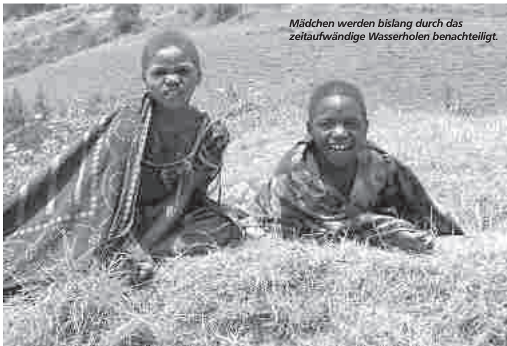
Mädchen werden bislang durch das zeitaufwändige Wasserholen benachteiligt.

Sie installieren Leitungen und Zapfstellen mit sauberen Einfassungen, die je zehn Häuser mit Trinkwasser versorgen.