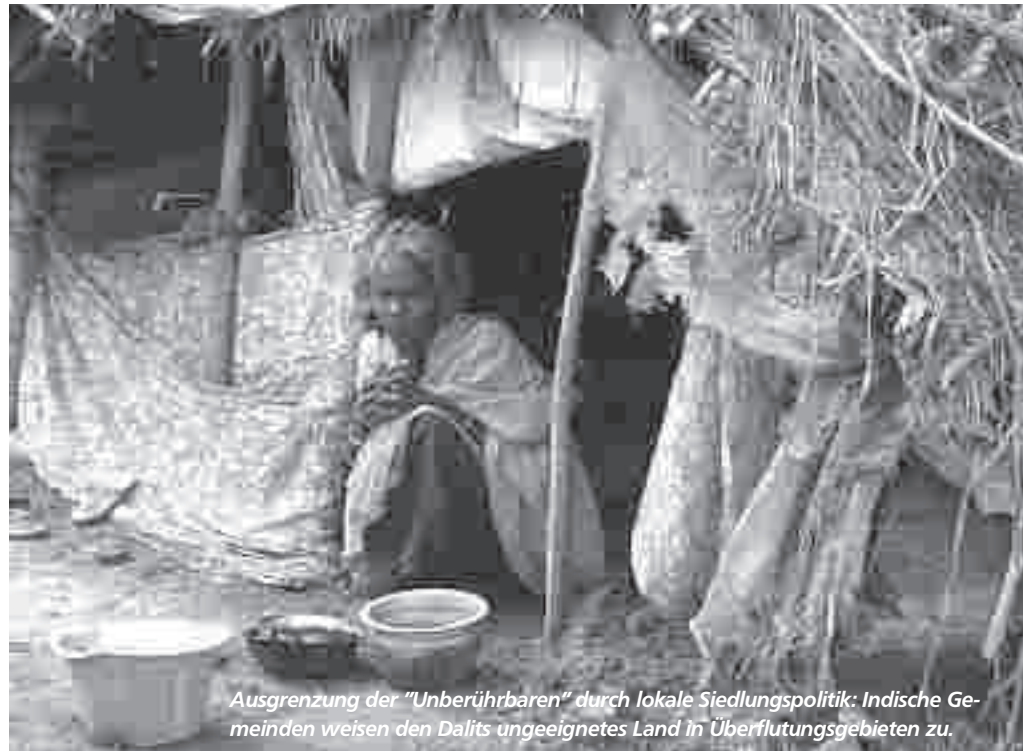
Ausgrenzung der „Unberührbaren“ durch lokale Siedlungspolitik: Indische Gemeinden weisen den Dalits ungeeignetes Land in Überflutungsgebieten zu.

Seit in den siebziger Jahren des vergangenen Jahrhunderts die Dalits verstärkt gegen ihre Diskriminierung aufbegehren, werden auch die Konflikte mit den privilegierten höheren Kasten